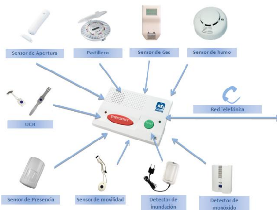
Sensores y periféricos que complementan las funciones del terminal domiciliario