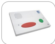
Terminal domiciliario analógico