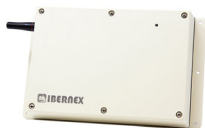
Monitores de puerta para interiores y exteriores